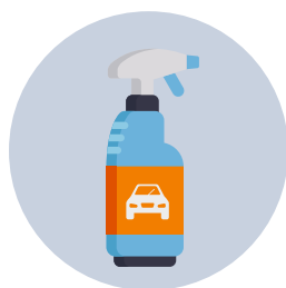
Productos comerciales específicos para la desinfección del interior del coche