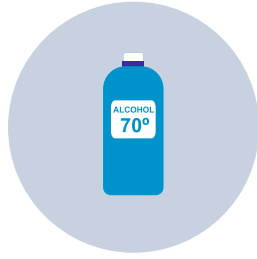
Productos que contengan al menos un 70% de alcohol