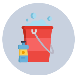
Agua y jabón abundantes