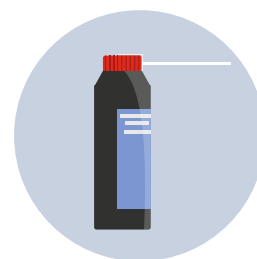
Sprays desinfectantes específicos para el aire acondicionado (Deberás ventilar el habitáculo después de usarlos)