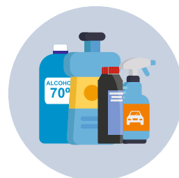
Productos de desinfección